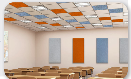
Plafond: soni COLOR RD / Paroi: soni COLOR